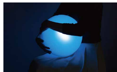
※「SOUND HUG」は、ピクシードラストテクノロジーズ社の商標です。